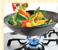
天然ガスの普及拡大