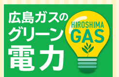
グリーン電力の販売