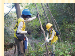
お客さまとの森林保全活動 (広島県緑化センター内広島ガスの森)

広島ガスグループは、2021年に「2050年カーボンニュートラルへの取り組み」を発信し、2050年のカーボンニュートラルを見据え、まずはCO2削減に貢献する取り組みを推進しています。