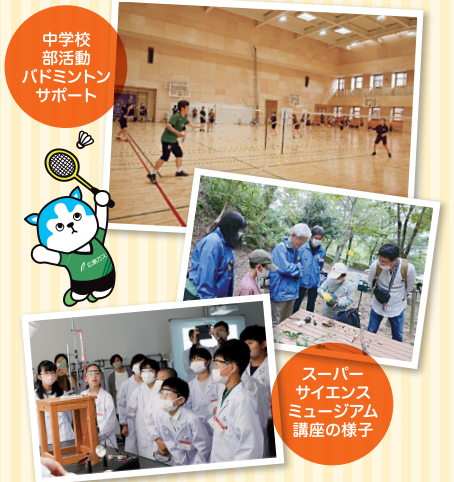
中学校 部活動 バドミントン サポート