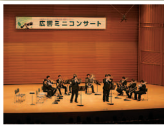
呉会場(金管十一重奏)

地域のお客さまへの感謝の意を込め、100周年記念プレイベントとして、三原・尾道・呉の3市でミニコンサートを開催しました。