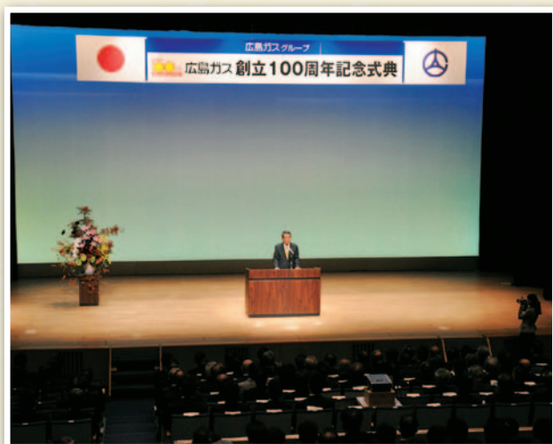
『創立100周年記念式典』(2009年10月27日開催)

創立100周年を記念し、当社はさまざまな記念事業を行いました。それは、地域への広島ガスグループの感謝の証でもあります。当社は、2020年に向けた新ビジョン「Action for Dream 2020」のイメージを表現した新聞の全面広告を、次の100年のはじまりである創立記念日(10月30日中国新聞朝刊)に掲載しました。この新ビジョンの実現に向け、当社は新たなる100年のスタートを切りました。