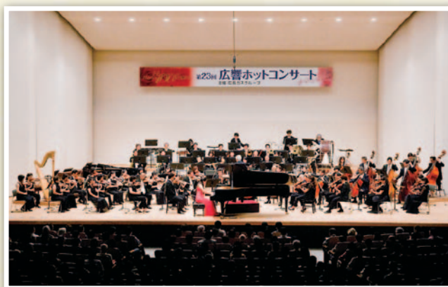
『第23回広響ホットコンサート』(2009年9月6日開催)

創立100年の節目の時に当社の今日までを記した「広島ガス100年史」を刊行しました。「戦前のガス事業」「エネルギー情勢の激変」「環境との調和」の3部構成で当社の創立以来100年の歴史を1冊にまとめました。