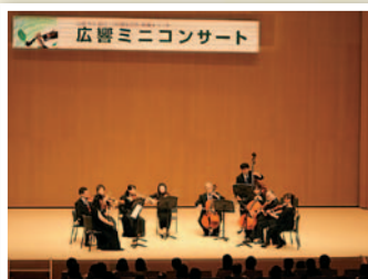
三原会場(弦楽十重奏)