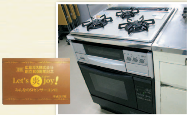
『Siセンサーコンロなどを寄贈』(2010年3月完了)

当社が創立100周年を迎えるにあたり、これまで支えてくださった皆さまに感謝の意味を込め、「広島ガス100年分の感謝のハーモニー」と銘打った、広島交響楽団による恒例のコンサート。初演からちょうど100年経過したラフマニノフのピアノ協奏曲をはじめ、華やかなバレエ音楽を中心にお届けしました。