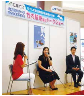
イオンモール広島祇園でのトークショー (2016年10月)

ひろしま観光大使として、スノーボード、スポーツのすばらしさを多くの方に伝えるため、地域のイベントにも参加しています。