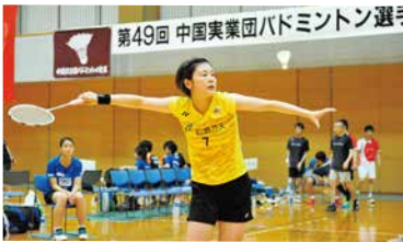
中国実業団バドミントン選手権大会

1995年3月に創部した女子実業団チームで、2017年現在、2部リーグにあたる日本リーグに所属しています。上位リーグであるS/Jリーグ昇格を目標に活動を続け、全日本実業団選手権、国民体育大会をはじめ、多くの舞台上で活躍しています。