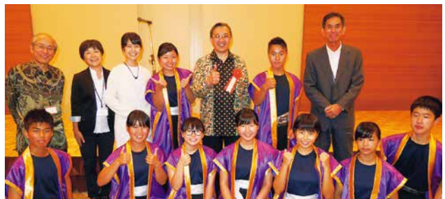
インドネシア共和国独立記念祭の様子

広島ガスでは、インドネシア共和国との友好・信頼関係を高めるとともに、両国間の交流推進を目的として、約220の法人・個人会員のご支援のもと、1996年から広島インドネシア協会の事務局を行っています。特に、多くのインドネシア留学生が在席している広島大学、広島で働いているインドネシア人看護師・介護福祉士の方々、インドネシアと関わりのある地元企業などと連携し、年間行事として総会・インドネシア共和国独立記念祭・講演会・インドネシア語講座・インドネシア料理を楽しむ会などの活動を行っています。