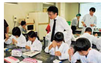
遺伝子実験の様子

対象は小学校5～6年生の選抜メンバーで、広島ガスが事務局を務め、学習指導要領にとらわれない高度な理科講座を年間17回程度展開しています。講座には、博物館などとの連携プログラムも取り入れています。