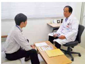
産業医の健康指導

健康診断時には保健師による問診を実施するとともに、健康診断後にも全従業員を対象に保健師がフォロー面談を行い、一人ひとりに対して健康診断結果に基づいた食事指導や運動その他日常の生活指導を行うなど、きめ細かい健康指導を行っています。