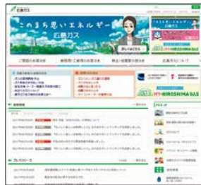
ホームページ画面

事業内容などを十分にご理解いただき、より多くの皆さまの快適な生活の創造にお役立ていただけるよう、ホームページにおいて多彩な生活情報・ガス器具やガスの保安に関する情報などを適宜ご提供しています。