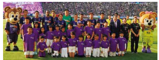
サンフレッチェ広島スポンサードゲーム(2017年4月)

Jリーグ「サンフレッチェ広島」をサポートし、地域の活力アップにつながるようにとの願いを込め、毎年「広島ガススポンサードゲーム」を開催しています。多くの役職員がエディオンスタジアム広島に集結し、サポーターとともに熱い声援を送りました。