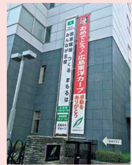
懸垂幕の掲示(本社ビル)