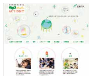
ホームページ「こどもエネルギー ACTION!!!」 http://www.hiroshima-gas.co.jp/action/