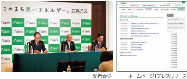
記者会見 ホームページ「プレスリリース」

広島ガスグループのトピックスや財務状況などの情報は、記者会見、プレスリリースなどを適宜実施してマスコミに提供し、ステークホルダーの皆さまに迅速・確実に伝達されるよう、積極的な情報発信を行っています。