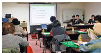
(公社)広島消費者協会との定例懇談会

広島ガス事業の取り組みについて地域の皆さまに理解を深めていただくため、(公社)広島消費者協会との懇談会を毎年開催しています。