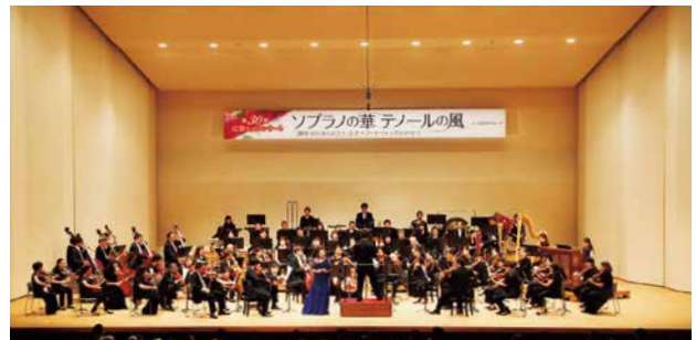
コンサートステージ

記念すべき30回目となる2016年度は、広島文化学園HBGホールにて「ソプラノの華 テノールの風『30年分のありがとう』をオペラ・オペレッタにのせて」と題して、ソリスト2名を迎え、華やかな名曲をお届けしました。記念演奏として1987年に開催された第1回広響ホットコンサートでの演奏楽曲を披露し、1,544人のお客さまにお楽しみいただきました。また、コンサート会場にて広島交響楽団の社会貢献活動「音楽の芽プロジェクト」を応援する募金活動も行いました。