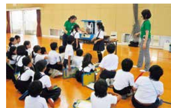
ライフライン防災教室の様子

中国電力㈱、広島市水道局と広島ガスが3者合同で、防災月間である9月に小学生とその保護者の方を対象とした防災教室を開催しています。子どもたちの防災意識を高めることを目的に、災害が起こった際に役立つ、ガス・電気・水道に関する知識を提供しています。