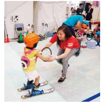
キッズスキー体験教室