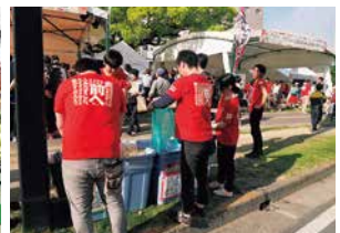
JT清掃活動への参加