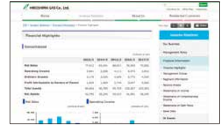
ホームページ「IR情報」(英語)

決算短信、有価証券報告書を発行しているほか、株主の皆さま向けの報告書を発行、会社説明会を実施するなど、適宜、広島ガスの活動内容や財務状況の全容を開示しています。