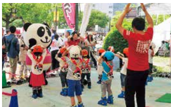
キッズスキー・スノーボード体験教室