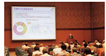
会社説明会(個人投資家向け)