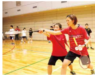
バドミントン講習会(地域の子どもたちへの指導)

地域貢献活動として、月1回程度中学生・高校生の広島県代表選手の指導、また地域の小学校などで講習会を行い、次世代の子どもたちにバドミントンを通してスポーツのすばらしさを伝えています。