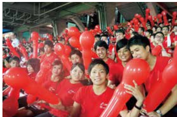
カープ合同応援(2016年8月)

地域の活性化をめざし、中国電力(株)、(株)広島銀行、(株)中電工、広島ガスの4社で地元プロ野球球団である広島東洋カープの合同応援を毎年実施しています。2016年度は8月に実施し、多くの役職員とその家族が、マツダZoom-Zoomスタジアムに集い、熱い声援を送りました。