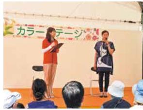
広島フラワーフェスティバル(2017年5月)