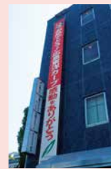
懸垂幕の掲示(呉支店)

2016年はカープが25年ぶりのリーグ優勝を果たし、広島のみならず、広島ガスのまちを真っ赤に染めました。広島ガスも、優勝を記念して、各事業所に懸垂幕を掲げ、優勝の喜びを分かち合いました。