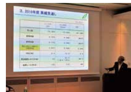
会社説明会(アナリスト向け)