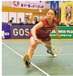
3名の期待の新人選手の加入