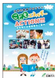
次世代教育プログラム パンフレット

次世代教育活動をまとめた総合パンフレット・ホームページを毎年更新し、小学校・中学校を中心に、さまざまな対象学年や習熟度に応じて選択いただける出張授業などを紹介しています。