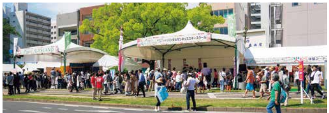
ひろしまフラワーフェスティバル GASLANDブース

環境保全の観点からも、他の企業と協力しながら、きれいな街づくりのために、JT(日本たばこ産業㈱)が主催する清掃活動にも参加しました。