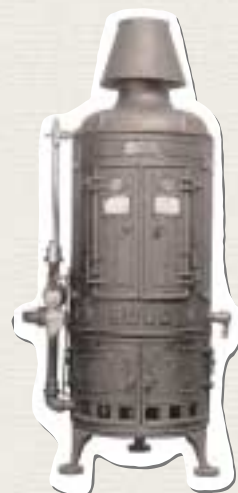
ルード湯沸器(昭和・戦前) Water Heater

During the late 1950s, baths in the home quickly became widespread.