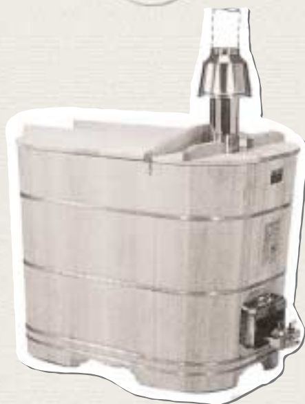
内釜付角丸木風呂 Bath

A gas stove with an attractive appearance.