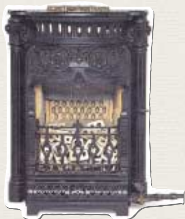
英国製リリーストーブ Space Heater