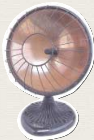
英国製ウェルスバツハ 25号放射スタンド型 ストーブ Space Heater

A water heater used during the Taisho and early Showa Era.