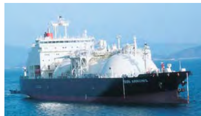
LNG船 サン アローズ

これによって、より安定したLNG供給体制の確立と、将来にわたるLNG調達コストの低減が期待されています。