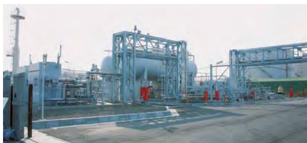
水島ステーション(瀬戸内パイプライン(株))

当社の連結子会社である瀬戸内パイプライン(株)の設備で、水島LNG基地から天然ガスを受け入れ、熱量調整等を行う設備「水島ステーション」および水島-福山間の導管(約40km)が2006年11月に完成しました。これにより、広島県東部等への天然ガス供給体制が整備され、2007年1月から当社が福山ガス(株)に卸供給を行っています。