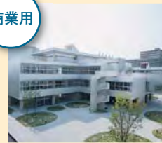
ホテル、ビル、学校等