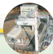
水島ステーション (瀬戸内パイプライン(株))