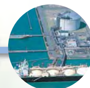
水島LNG基地 (水島エルエヌジー(株))