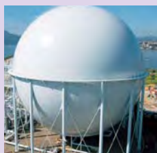
球形ガスホルダー