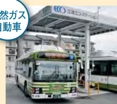
トラック、バス、乗用車等