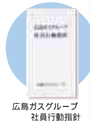
広島ガスグループ 社員行動指針

お客さまへの誠意ある対応 事故・苦情への迅速な対応と再発防止 法令および社内規程等の遵守 節度ある言動に努める 社会人としての社会的ルールの遵守