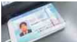
IDカードによるセキュリティ強化 (パソコン起動・操作、入出門)