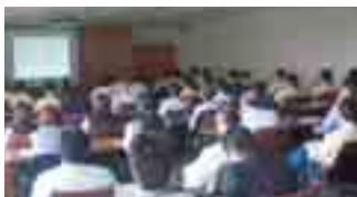
情報セキュリティ学習会

情報漏洩等によるリスクに対しては、「情報セキュリティポリシー」に従って、情報セキュリティ委員会を中心とした体制を構築し、個人情報の取り扱いに関する社内啓発活動をはじめ、情報漏洩事故の発生防止に努めるとともに、発生時における情報開示等のあり方についても規程化し、機動的な対応を図っています。